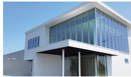
福島県南相馬市原町区萱浜字巢掛場45-245 南相馬市産業創造センター 原ノ町駅から車で5分 道の駅南相馬から車で3分