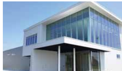
福島県南相馬市原町区萱浜字巣掛場45-245 南相馬市産業創造センター 原ノ町駅から車で5分 道の駅南相馬から車で3分